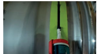
Patroon 310ml - Art. 604006000

Sticky Seal is een blijvend soepele en kleverige afdichtingkit voor water- en luchtdicht maken van toepassingen in automotive en industrie.