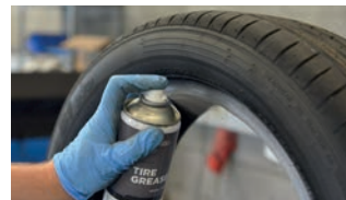
Aerosol 400ml - Art. 233981000

Hi-tech vernevelbaar vet voor demonteren en monteren van banden. Aangename geur en droogt niet uit.