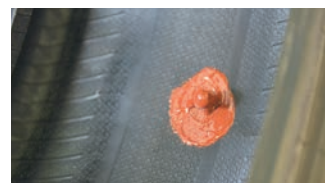
Bus 500ml - Art. 704010000

Zelfvulcaniserende vloeibare butylrubber voor tubeless herstellingen. Eenvoudig aan te brengen. Past zich snel en eenvoudig aan iedere vorm aan.