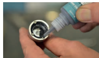
Fles 15ml - Art. 314510000