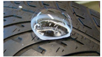
Aerosol 300ml - Art. 750131000

Spoort in enkele seconden luchtlekken op. Niet corrosief en veilig op alle oppervlakken. Kleurloos, geurloos en niet giftig. Extreem lange standtijd.