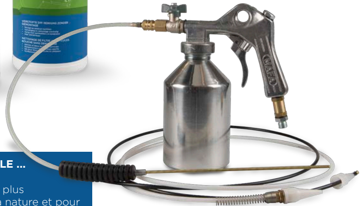
Novaflush DPF pistolet N° d'article 740304390