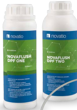
DPF One (500ml) + Two (1L) N° d'article 998010000

Novaflush DPF est le système professionnel de nettoyage et de débouchage et solutionne tous les cas de filtre DPF complètement obturé, pour tous types de moteurs diesel équipé de filtre à particule et de catalyseur. Nettoie et enlève les particules de suie de la structure poreuse du DPF. Novaflush DPF One nettoie et décompose les particules et le Novaflush DPF Two enlève l'encrassement.