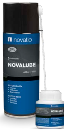
120gr N° d'article 221002000