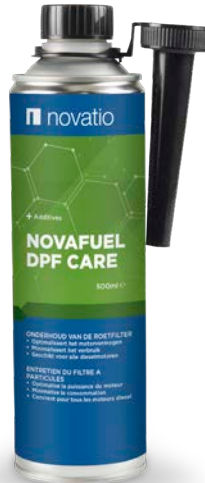
500ml N° d'article 740301000

Novafuel DPF Care est l'entretien professionnel pour les dernières générations et garantit un filtre à particules performant, ainsi que le catalyseur et le compresseur turbo, aussi à géométrie variable. DPF Care contient un promoteur de combustion diminuant la température de combustion des particules de suie avec 33% (de 600°C à 400°C). Le dépôt de suie est ainsi transformé en énergie, optimisant la puissance du moteur et en minimisant la consommation.